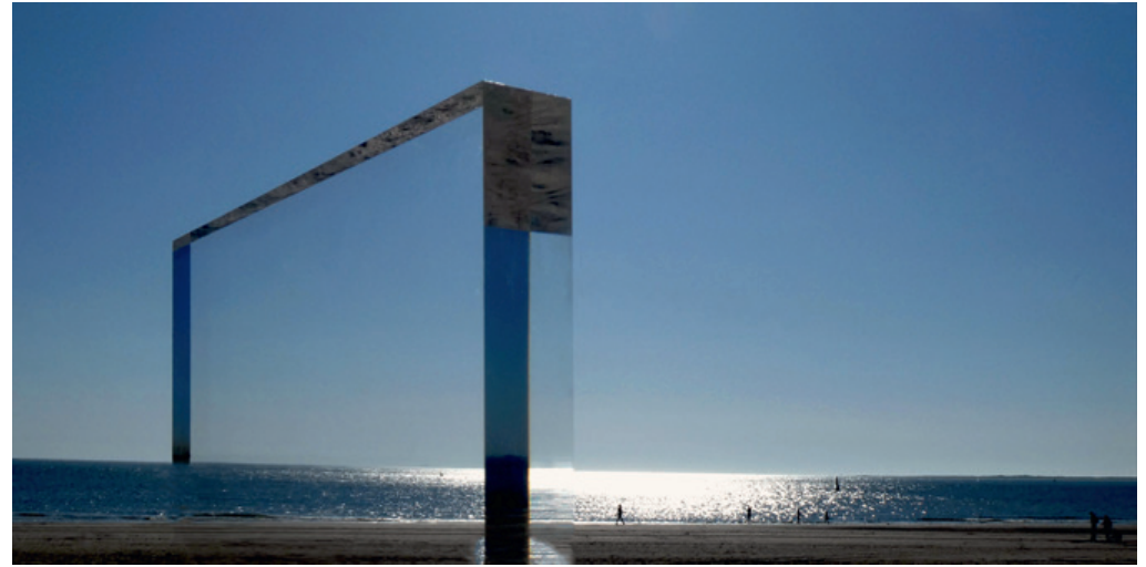
Tor zum Horizont 2