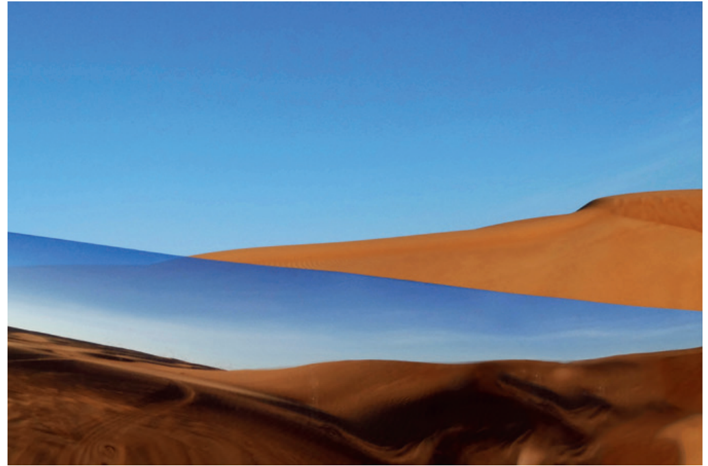
WüstenSpiegel 3 HD Metal Print · 60 x 90 cm · 2020