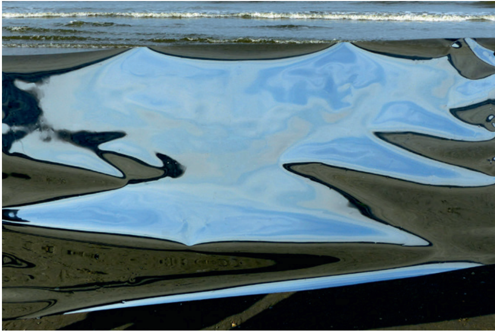
"...Himmel und Erde"