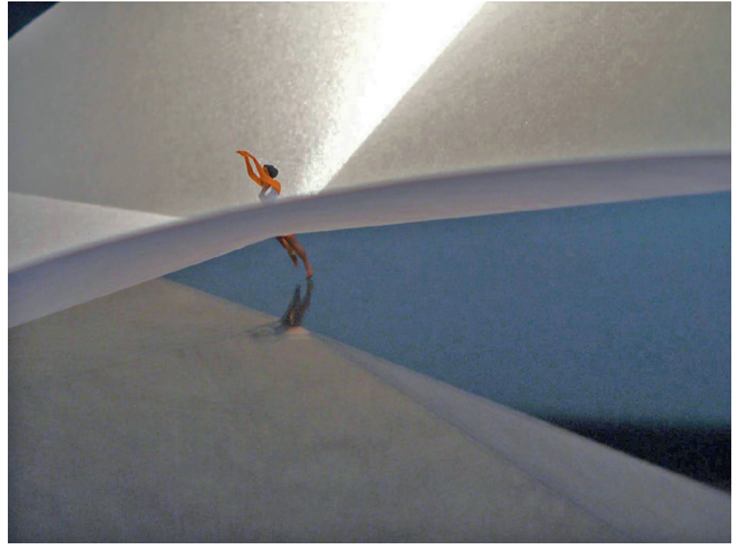
Ballerina – ganz leicht