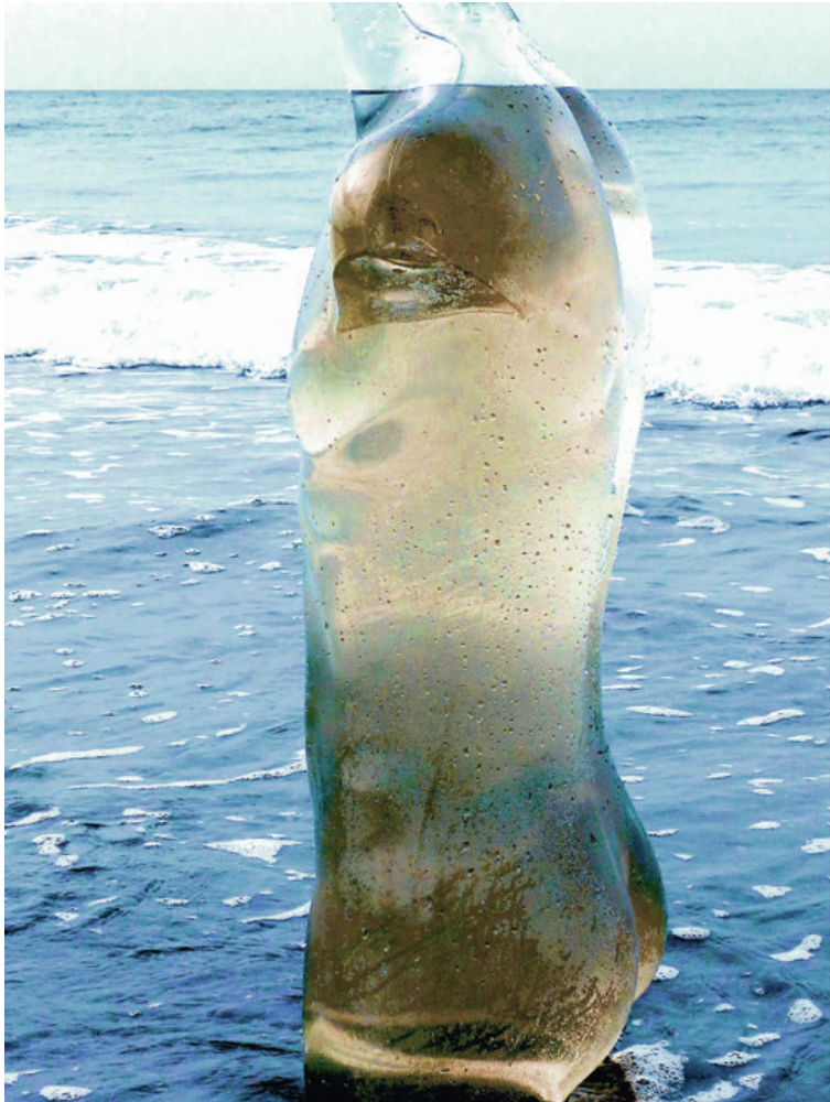
Lichtskulptur – Wassermann 3 Acrylglas 66 x 88 cm 2016