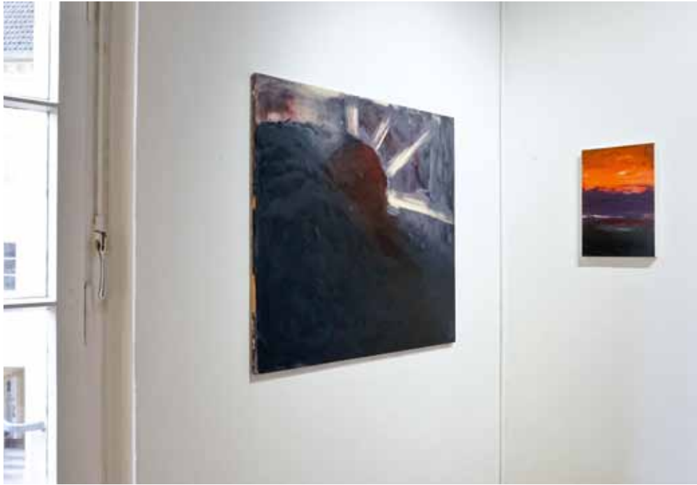
Oben | Meinhard Schulte | linke Wand | aufscheinen 2023, Öl auf Leinwand, 105 B x 95 H cm, rechte Wand | o.T. 2017, Öl auf Holz, 30 B x 45 H cm