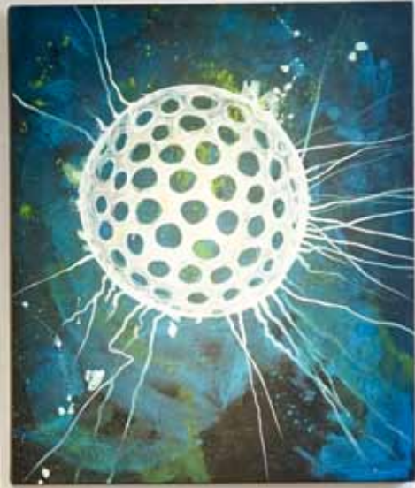
Links | Maria Allefeld | Links im Bild, Blasenpflanzen 2015, Öl auf Leinwand, 75 B x 120 H cm, rechts im Bild, Foraminiferum 2017, Öl auf Leinwand, 100 B x 120 H cm Rechts | Maria Allefeld | Impressionen