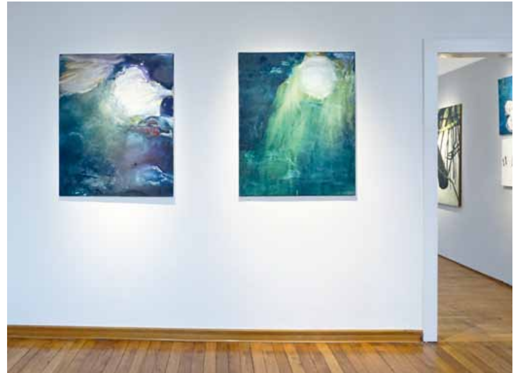
Links im Vordergrund | Meinhard Schulte | inmitten des lärmens 2022, Öl auf Leinwand, 105 B x 130 H cm Oben | Meinhard Schulte | links, durchdringen 2023, Öl auf Leinwand, 85 B x 105 H cm, rechts, grünes leuchten 2023, Öl auf Leinwand, 85 B x 105 H cm